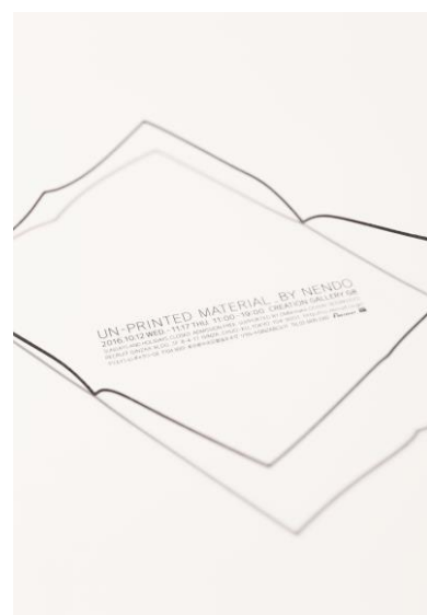
本展覧会ポスター

デザイナーのみならず、誰でも日常であたりまえに触れる「紙」の存在を、輪郭から捉えた展覧会は、わたしたちに紙の記憶やイメージを喚起させてくれることでしょう。そして、ものの見方を変えることや観察することで生まれる、楽しさ、豊かさに気づく機会になればと考えています。