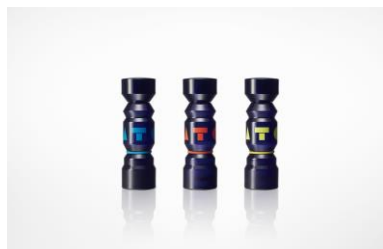
TOTEM, perfume bottle for Kenzo 2015