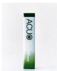
ACUO, chewing gum package for LOTTE 2006