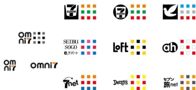
omni7, VI for Seven & i Holdings 2015

リクルートホールディングスではこれからも、働く、学ぶ、住む、結婚、育児、旅、車、趣味や暮らし情報など、さまざまな場面でユーザーが新しい発見・機会創出できるサービスを提供し、ひとりひとりにあった「まだ、ここにはない、出会い。」を届けることを目指していきます。