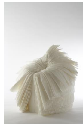
cabbage chair for 21_21 Design Sight 2008