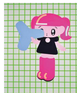
6. モニョチタボミチ